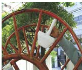
頭部や胴体の挟み込み危険部位の特定

定期点検の結果、処置すべきハザードが確認された場合は、その程度に従って応急修理などの適切な処置をします。