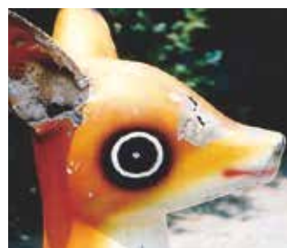
FRPのガラス繊維の露出