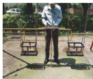
形状寸法値の確認