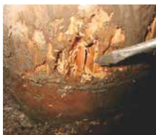
シロアリによる侵食