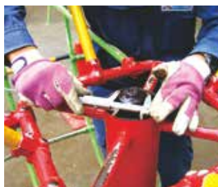
可動部の摩擦や変形の確認

プラスチック系材料は、子どもが触れたり乗ったりするので必ず荷重をかけて確認します。またFRPなどガラス繊維の露出によるケガをしやすい状況に留意します。